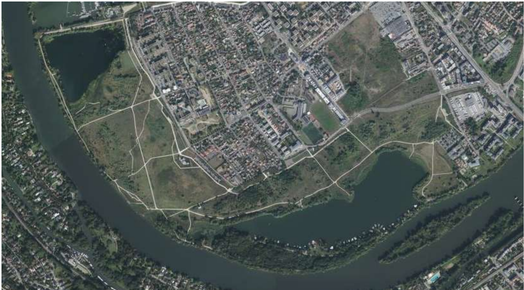
Vue du Parc départemental du Peuple de l'herbe