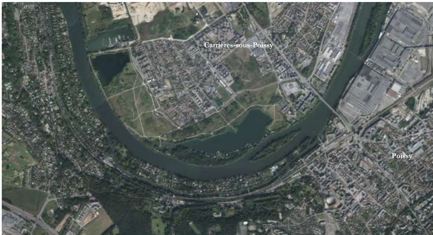
Vue du Parc départemental du Peuple de l'herbe inséré dans la frange urbaine de Carrières-sous-Poissy